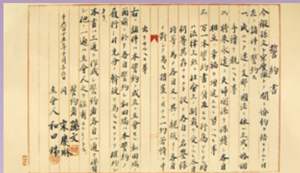
孙中山与宋庆龄结婚誓约书 (1915年)