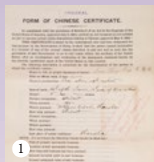
1. 宋庆龄1907年 (清光绪33年) 出国留学护照