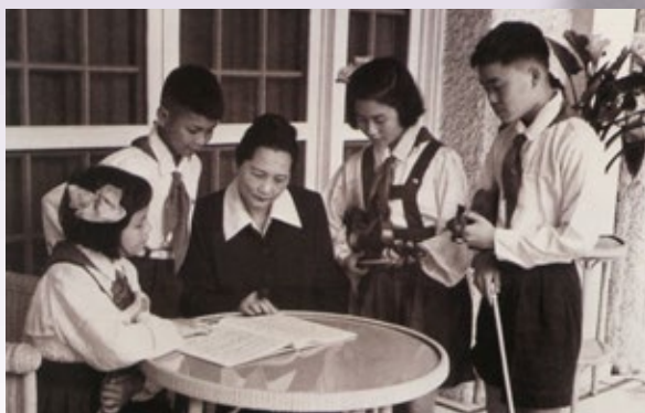
宋庆龄邀请儿童艺术剧院管弦乐队员到家里做客 (1957年)