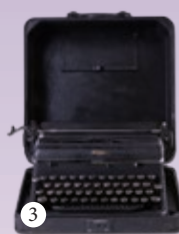
3. 美国皇家打字机公司生产的“皇家”牌打字机 (1960年代)