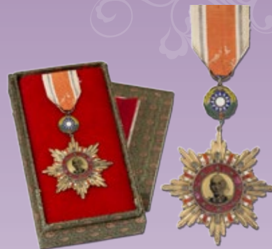
国民政府颁发给宋庆龄的抗战胜利勋章 (1945年)